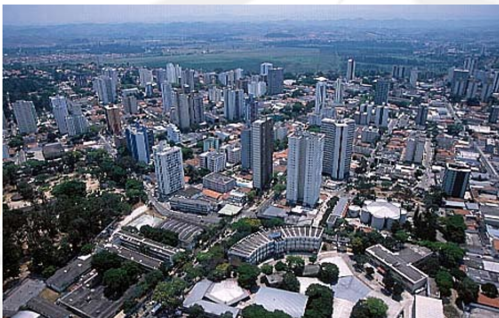
São José dos Campos vista aérea

Ficou acordado que a partir do dia 1º de setembro de 2010 serão disponibilizadas as senhas para a promotora e para o juiz e estes passarão a acessar o sistema para acompanhar a situação dos acolhimentos.